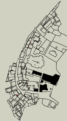
VIA SALITA DELLA CHIESA