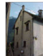
TAVOLA 17 PROGETTO